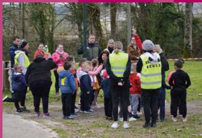
Cross des écoles Joinville - 1 avril