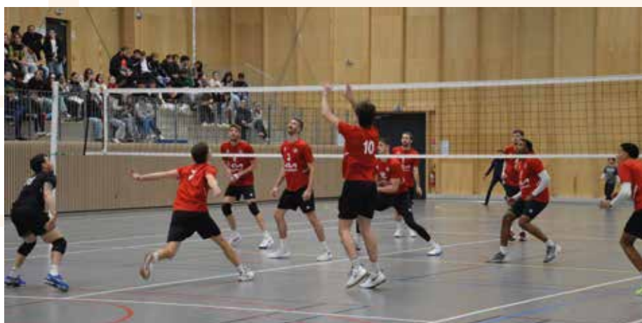
Entraînement du CVB 52 au Complexe Intercommunal le Fair-Play, le 5 novembre 2025 à Joinville

L'ouverture de l'Escale Vitalité est prévue au cours du premier trimestre 2026, pour offrir aux sportifs, accompagnants et visiteurs un moment de détente sain et convivial – à l'image de l'esprit FAIR-PLAY.