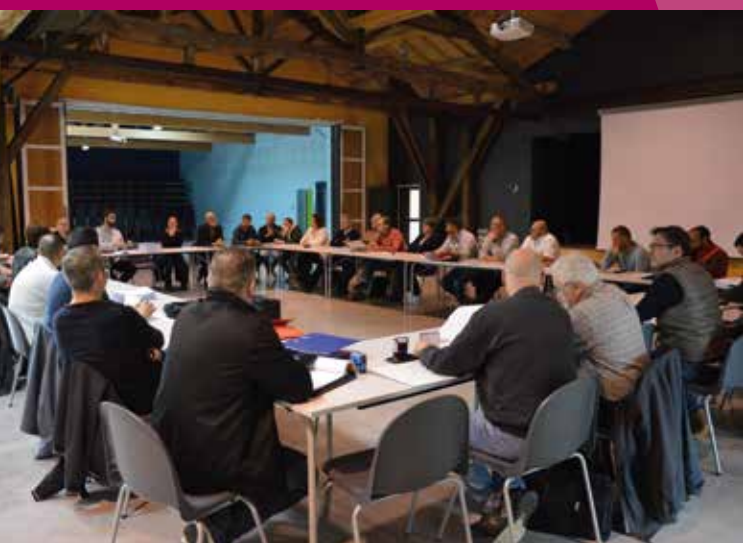
Signature marchés du GS Doulevant - mai