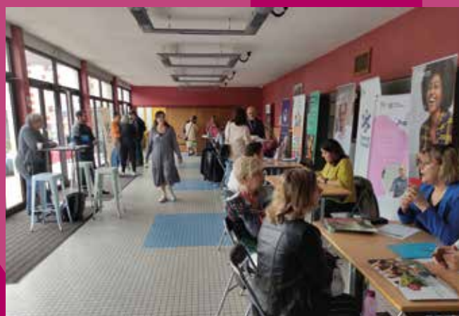
Place de l'emploi à Joinville - 6 juin