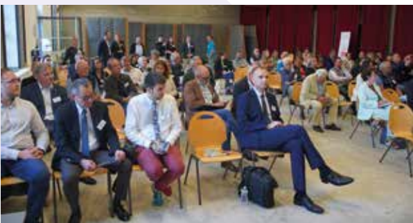
Réunion des 4 EPCI à Montiers-sur-Saulx, le 17 septembre 2025