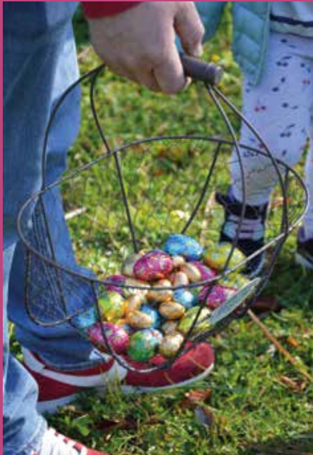
Animation Pâques Château grand jardin - 4 avril