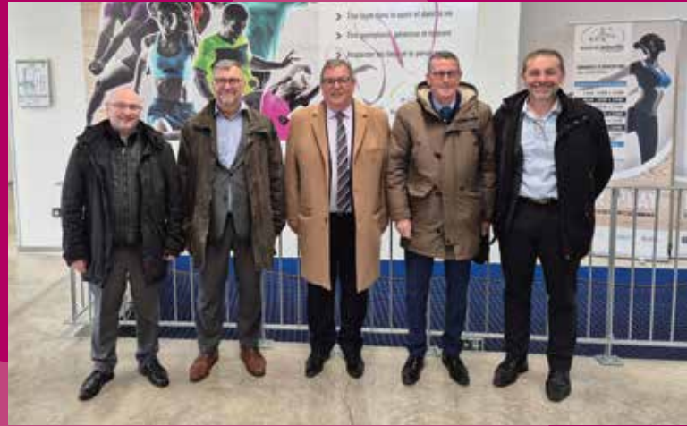
Visite du délégué interministériel à l'accompagnement des territoires en transition énergétique, Yves SCHENFEIGEL - 13 mars