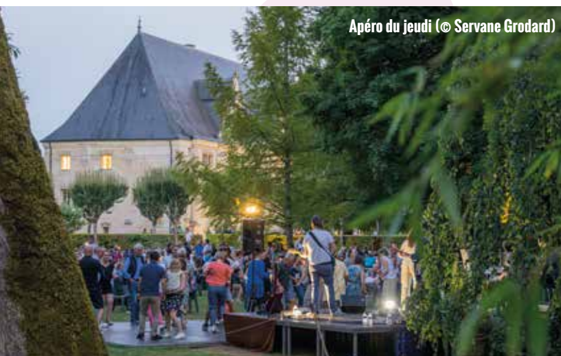
Apéro du jeudi

De l'Été du Grand Jardin aux balades commentées dans nos villages, en passant par les visites-apéros à Joinville, la saison 2025 a une fois de plus fait vibrer le territoire ! Animations, découvertes et convivialité : revivez en images et en chiffres une année haute en couleurs !