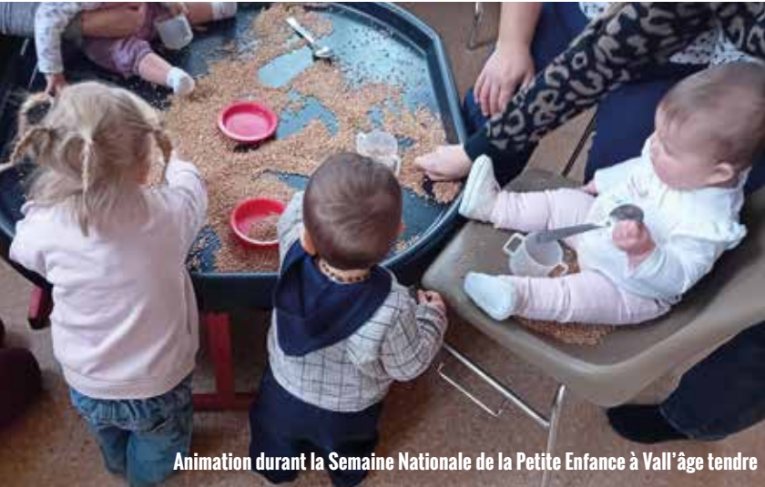
Animation durant la Semaine Nationale de la Petite Enfance à Vall'âge tendre