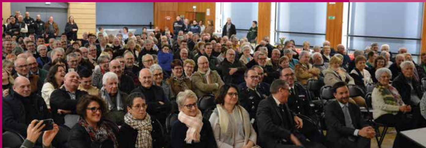
Public cérémonie des vœux mutualisée avec ville de Joinville - 31 janvier