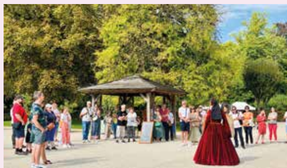
Visite costumée