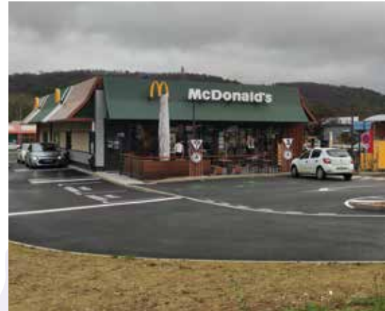
Nouveau restaurant McDonald's à Joinville, sur le parking de Super U

Toute demande de projet doit être adressée au Président de la Communauté de Communes et être envoyée au siège, 3 rue des Capucins, 52300 Joinville.