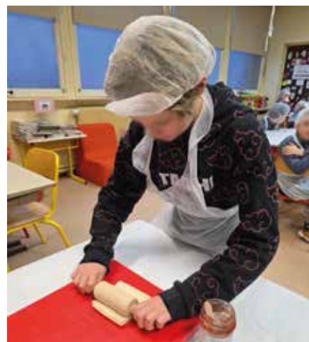
Atelier « Goûter Équilibré » au Groupe scolaire de Donjeux

un livret récapitulatif est remis à chaque enfant et comprend les différentes phases de confection des goûters. Ce support vise à montrer aux parents ce que les enfants ont réalisé durant la garderie et à permettre de reproduire les recettes à la maison, pérennisant ainsi les acquis et bienfaits de l'activité.