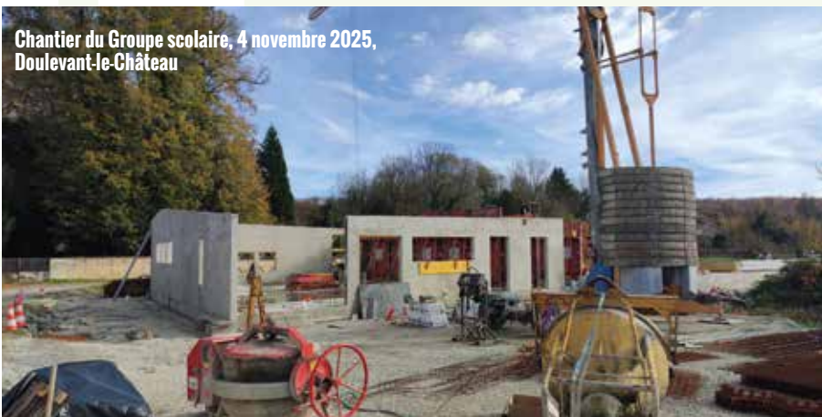
Chantier du Groupe scolaire, 4 novembre 2025, Doulevant-le-Château