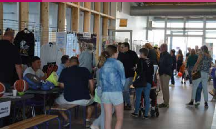
Forum des associations à Joinville - 5 septembre