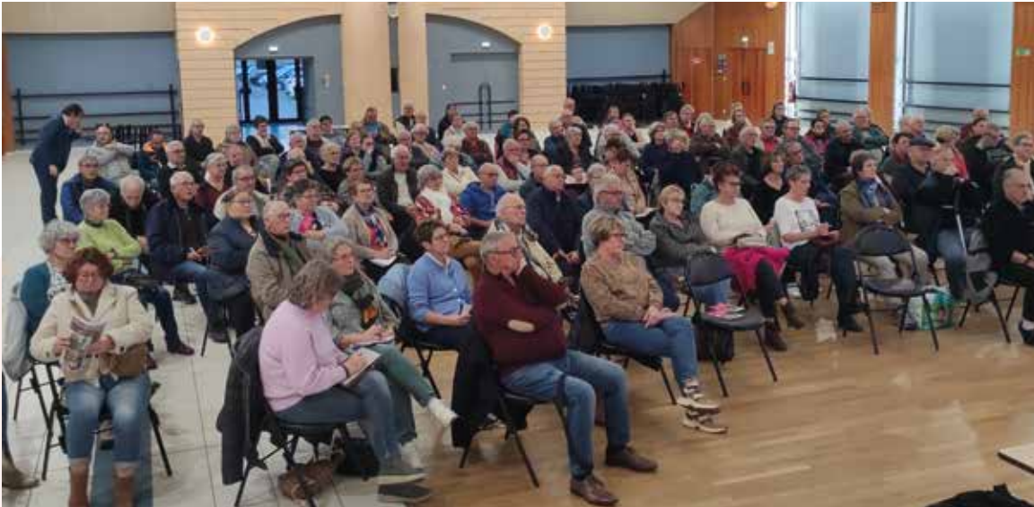
Réunion publique pour la Mutuelle Just dans la salle des fêtes de Joinville, le 4 novembre 2025

Grâce au nouveau partenariat établi par la CCBJC avec la Mutuelle Just, signé le mardi 4 novembre à la Mairie de Doulevant-le-Château, toutes les personnes qui n'ont pas de mutuelle imposée par leur employeur peuvent désormais souscrire à la mutuelle intercommunale.