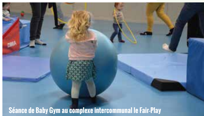
Séance de Baby Gym au complexe intercommunal le Fair-Play

Afin de favoriser une organisation optimale des séances, les familles sont invitées à signaler toute absence dans les plus brefs délais. Pour ce faire, elles peuvent contacter la micro-crèche au 03 25 55 35 90, le Relais Petite Enfance au 09 67 35 35 90 ou l'Espace Vall'âges au 03 25 94 21 68.