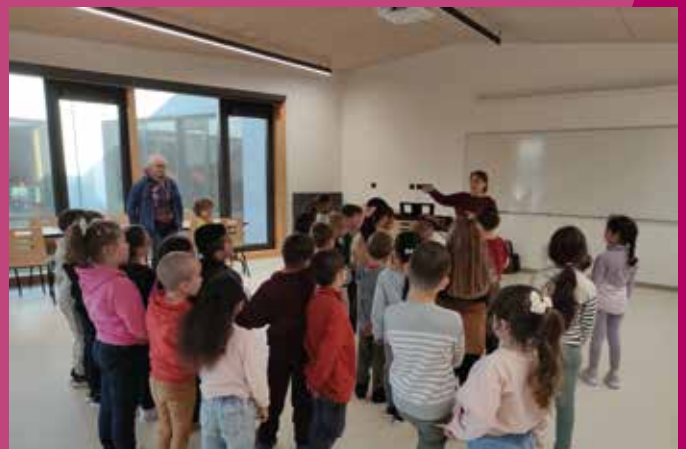
Projet chorale école Diderot - 16 octobre