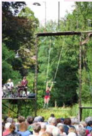
Spectacle été