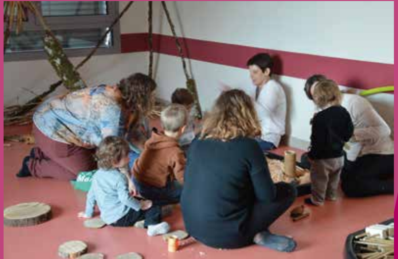
Semaine Nationale de la petite enfance