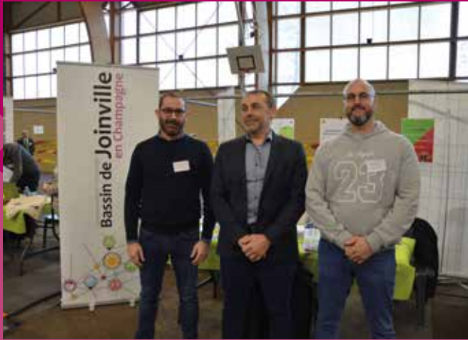
Forum de l'emploi à Chaumont - 7 et 8 mars