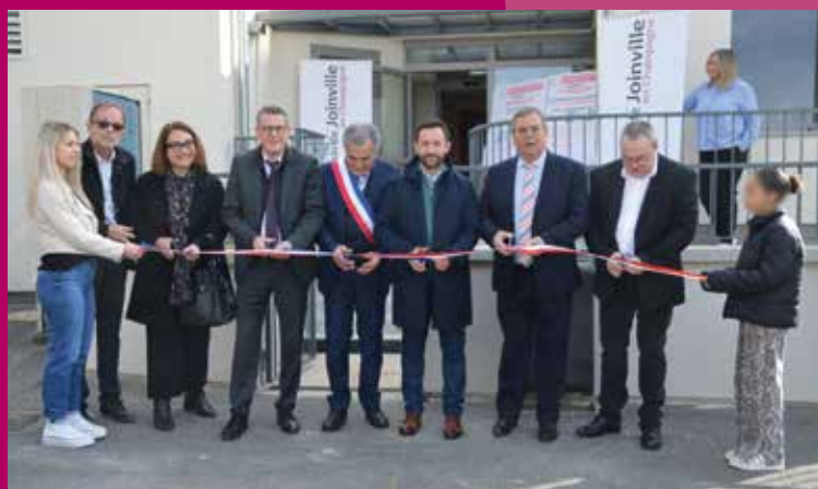
Inauguration micro crèche Thonnance - 22 mars