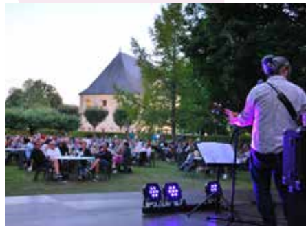
Apéro du jeudi