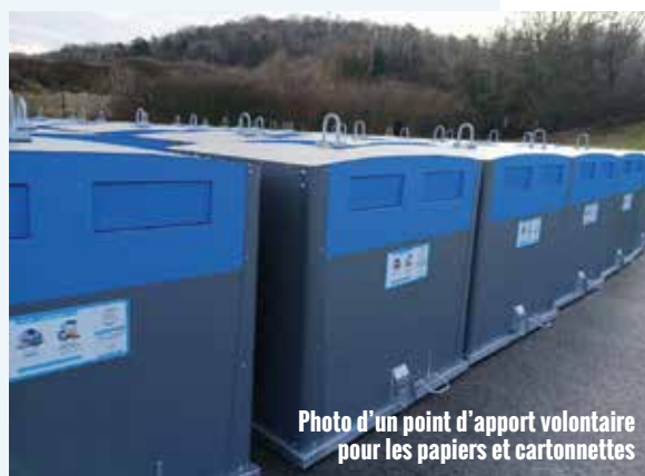
Photo d'un point d'apport volontaire pour les papiers et cartonnettes

Merci de sortir vos bacs ou sacs la veille au soir.