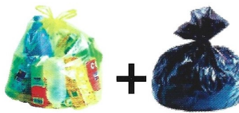
Sac jaune + ordures ménagères*

Sortir vos déchets la veille au soir * Collecte par camion bi-compartmenté